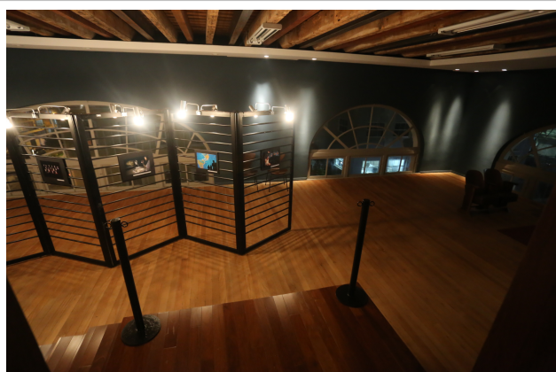
Mostra "Udesc, 50 anos construindo o saber" tem fotos de concursos da universidade

Até 30 de julho, o Museu da Escola Catarinense (Mesc), da Universidade do Estado de Santa Catarina (Udesc) em Florianópolis, sediará duas mostras fotográficas que resgatam parte da memória de SC e tiveram início na abertura da programação das atividades dos 50 anos da Udesc .