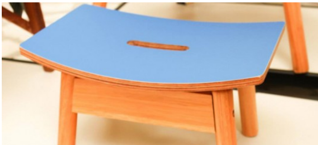
Evento gratuito reúne 41 itens de 16 marcas do Estado

Pré-evento de bienal brasileira, exposição pode ser visitada até 18 de maio