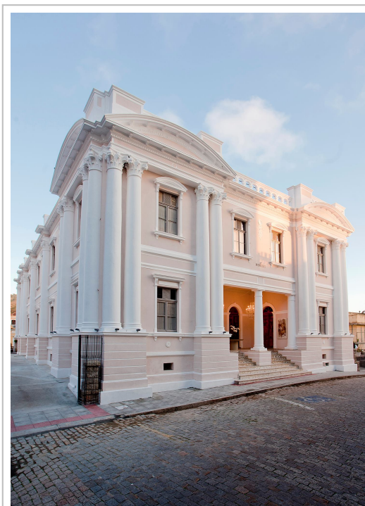
Mesc terá outras melhorias no próximo ano

Espaço continuará a receber melhorias para virar centro cultural em 2014